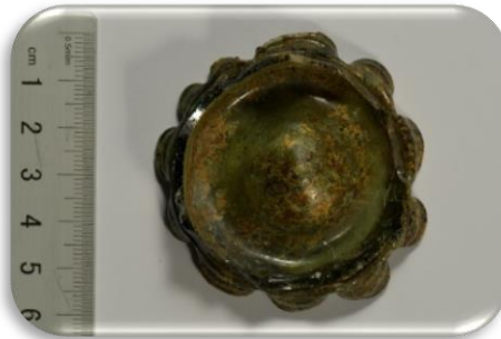
Stiklinės formos indo dugnelis, XVII – XVIII a. 1 pusė