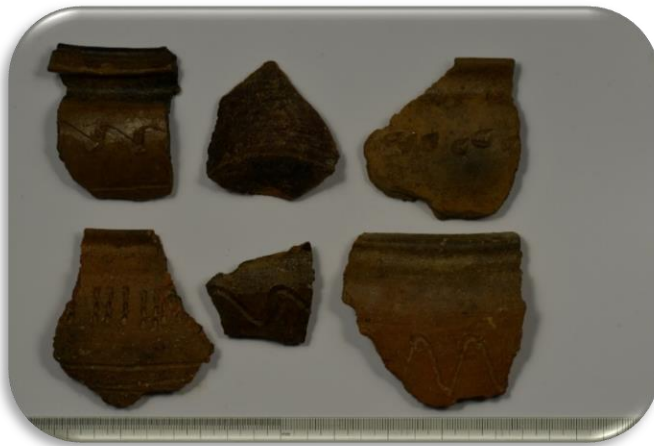
Indų fragmentai, XVII-XIX a.

Kupiškio miesto širdis- Lauryno Stuokos Gucevičiaus aikštė. 2019 m.