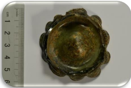
Stiklinės formos indo dugnelis, XVII – XVIII a. 1 pusė