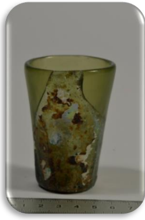
Stiklinės, XVIII – XIX a.