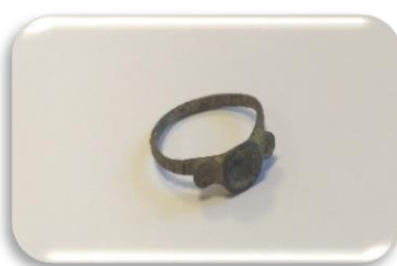
Žiedelis trijų lizdų

Metalo dirbiniai surinkti su metalo detektoriumi