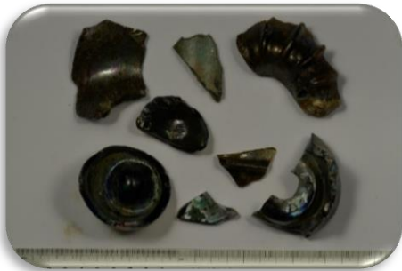
Stiklinių indų fragmentai, XVII 2 pusė – XVIII a.