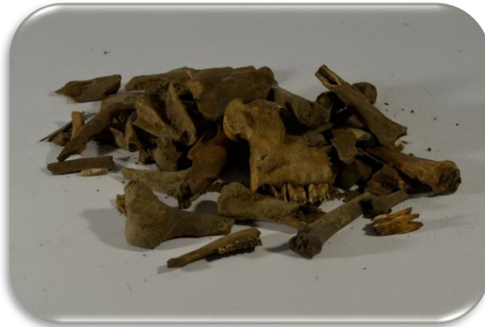
Gyvulių kaulai surinkti aikštėje

Kupiškio miesto širdis- Lauryno Stuokos Gucevičiaus aikštė. 2019 m.