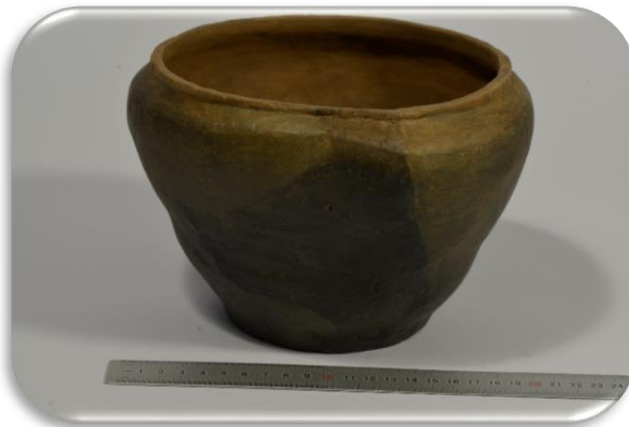
Virtuvės indas, XVII-XIX a.