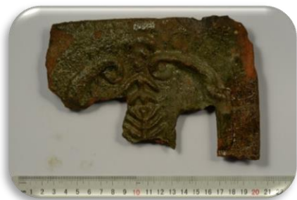
Sieninio koklio fragmentas, puoštas augaliniu ornamentu XVII a. 2 pusė

Kupiškio miesto širdis- Lauryno Stuokos Gucevičiaus aikštė. 2019 m.