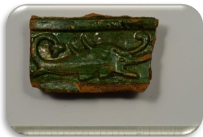
Carnitineo koklio fragmentas, puoštas delfino motyvu XVII a.