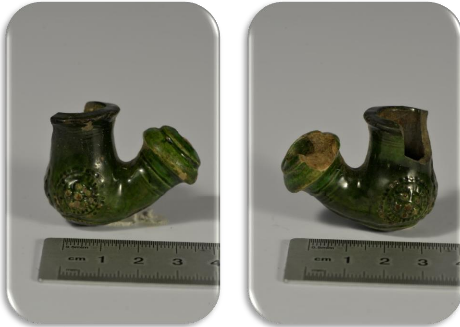
Keramikinė glazūruota pypkė, XVII a. pab. – XVIII a. pr.

Kupiškio miesto širdis- Lauryno Stuokos Gucevičiaus aikštė. 2019 m.