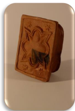
Sieninis koklis, puoštas žvaigždės ir rozetės deriniu, XVII a. 2 pusė – XVIII