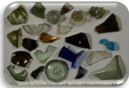
Stiklinių indų šukės, XVIII – XX a.

Kupiškio miesto širdis- Lauryno Stuokos Gucevičiaus aikštė. 2019 m.